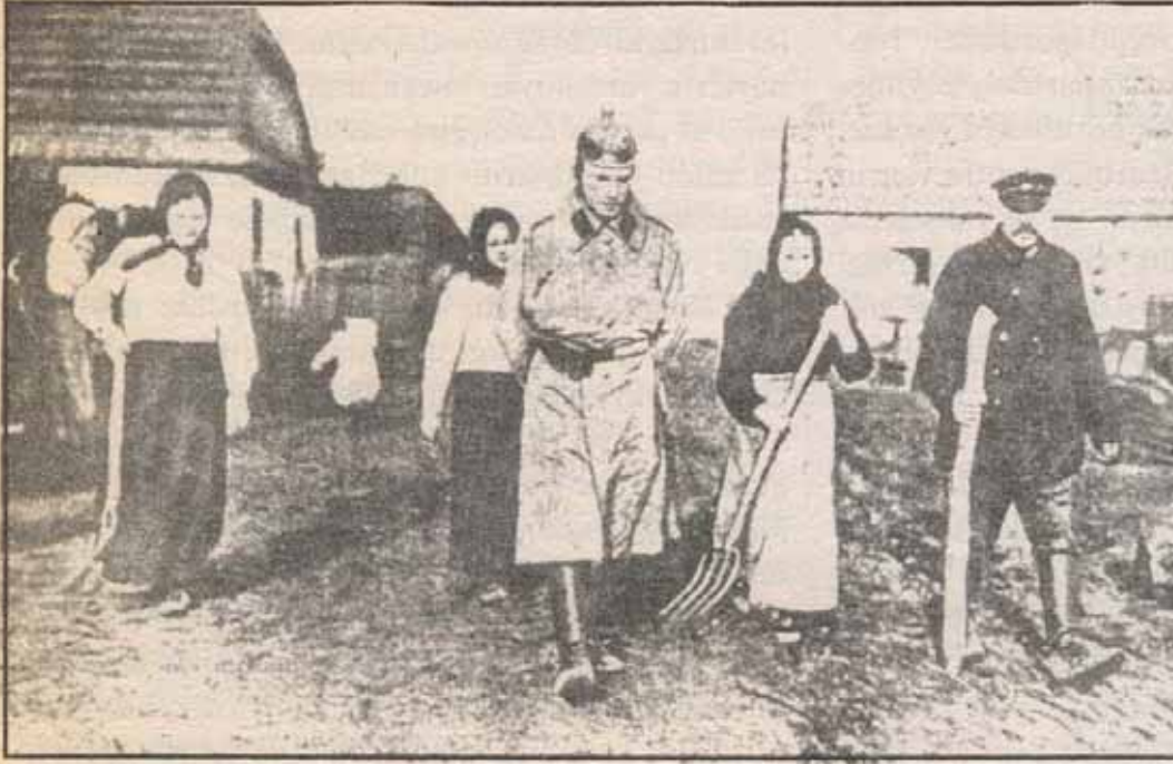
1914 Rusya'sında köylüler tarafından esir alınmış bir alman askeri

Kır emekçilerinin örgütlenme araçlarından biri Devrimci Köylü Komiteleridir. Komiteler, yoksul köylü komitelerinin yanında küçük köylüleri de kapsayacak karma komiteler biçiminde de oluşturulur. Devrimci Köylü komiteleri, köylülerin günlük sorunlarının çözümü için mücadele verirken, aynı zamanda devletin yıkılması içinde mücadele verirler. Bu amaçla mücadelenin ekonomik ve politik araçlarını bir araya getirirler. Yani bir taraftan tarım girdi fiyatlarını, genel fiyat artışlarını, vergileri vb. protesto eylemlerine başvururken; diğer taraftan büyük toprakları ve devlet ürün silolarını işgal etme eylemlerini geliştirirler, aynı zamanda devlet güçlerine karşı silahlı politik eylemlere yönelirler.