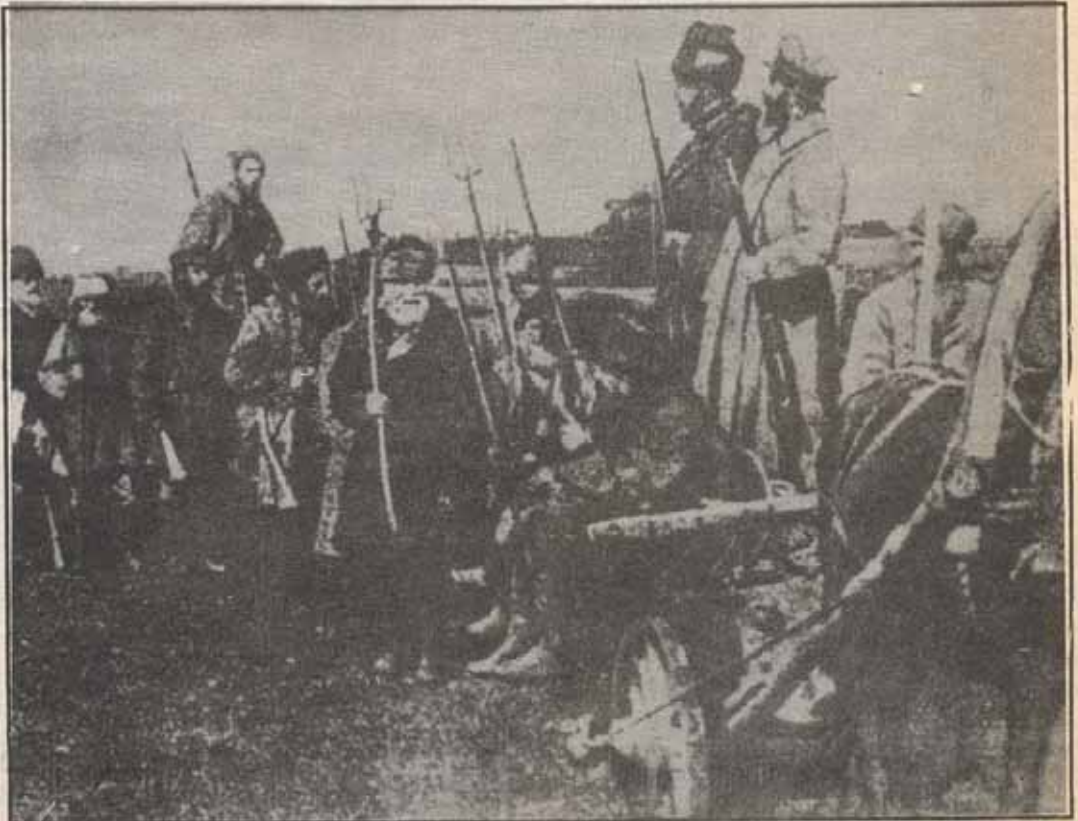
Bir bölük Devrimci Köylü Nisan 1917 Rusya.

Köylülüğün devrimci olanaklarının demokratik