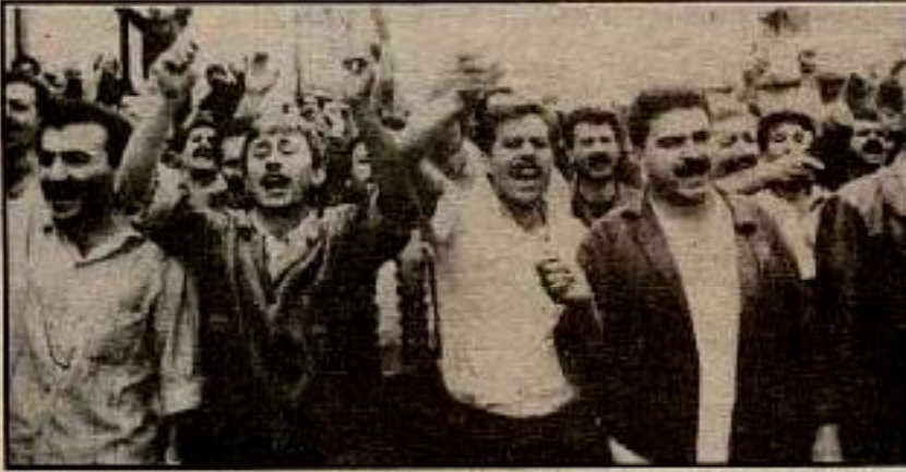
Haliç civarındaki 5 ayrı işyerinden işçilerin toplu vizite eylemleri, Sanki sınıfın 89 Bahar Eylemlerinden bugüne gönderilen bir mesaj: «İşçi sınıfının mücadele birliği bir zorunluluktur.»

litikasındaki bu bunalım, ezilen sınıfların hoşnutsuzluk ve kırılganlıklarının ortaya dökülmesini sağlayacak bir gedik açığı zaman; bir devrimin olması için çoğu zaman alttaki sınıfların "eski biçimde yaşamak" istememeleri yeterli değildir; "üstteki sınıflarında" eski biçimde yaşayamaz duruma gelmeleri" gerekir.