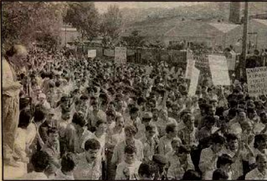
Paşabahçe işçi sınıfına hangi toplumsal katmanlarla birlikte hareket edebileceğini gösterene önemli bir eylemdi.

kara yürüyüşü" giderek bir siyasi karakter kazandığı gibi, bundan böyle direnişlerin nasıl olması gerektiğini de işçi sınıfının diğer kesimlerine göstermiş oldu. Zonguldak maden işçilerinin burjuva sendikacılar tarafından aldatılıp satılmaları, konumuz açısından bir anlam ifade etmez. Burada esas olan, Lenin'in ifadesiyle, yığınların bizzat yönetici sınıflar tarafından eyleme nasıl sürüklendiklerini görebilmektir.