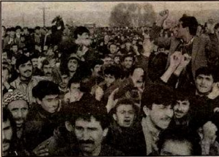
Tütün üreticileri dün ANAP'a karşı yaptıklarını DYP – SHP hükümetine karşı yapmakta da gecikmediler. Zira çıkarı korunanlar yine aynı sınıflar ve aynı çevrelerdi.

ci durumun olmadığını mı? Hayır değil. Sadece şunu anlatır ki, eğer bu koşul olmazsa nesnel olarak, tüm sınıf ve partilerin iradelerinden bağımsız olarak var olan devrimci durum bir devrimle sonuçlanmaz. İşte bunu anlatır.