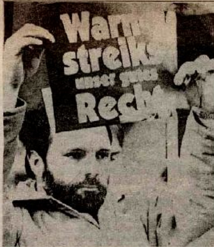
Avrupa'a grevler giderek yaygınlaşıyor