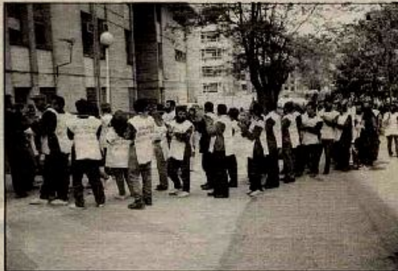
Kağıthane işçilerinin direnişi çeşitli biçimlerde sürüyor