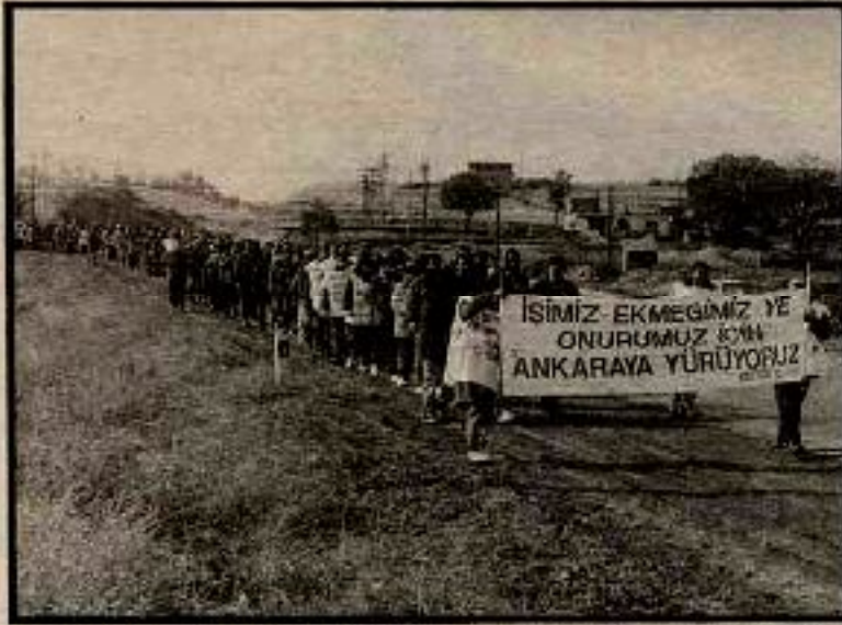
Ölüm Yürüyüşü, işçi hareketinin önemli eylemlerinden biri olarak tarihteki yerini aldı, ama yeterince irdelenip gereken dersler çıkarıldı mı yoksa işçiler iye döndü nasılsa bu da bitti mi denildi?

rimci durumun Türkiye ve Kürdistan'ın her yerinde her dönemde aynı düzeyde ve aynı tempoda gelişmesini beklemez, ileri sürmez. Eğer devrimci durum saptaması yapmak için örneğin Kütahya ve Bilecik'te olayların Cizre ve İstanbul düzeyine gelmesini bekleyenler varsa boşuna bekliyorlar. Ama hangi aklı başında kişi, Adana, Alanya, Fethiye vb. yerlerdeki olayların Kürdistan'daki gelişmelerin doğrudan bir sonucu olduğunu yadsıyabilir. Kürdistan'da bir iç savaşın sürüp gittiğini görüp saptamak için teoriye gerek yoktur. Ortalama muhakeme gücüne sahip herkes bunu görüp saptayabilir. Burada önemli olan tekellerin sermayenin başta İstanbul, Adana, Ankara ve İzmir'de önlemlerini neden yoğunlaştırma ihtiyacını hissettiğini çözümleyebilmek, sürecin nelere gebe olduğunu görebilmektir.