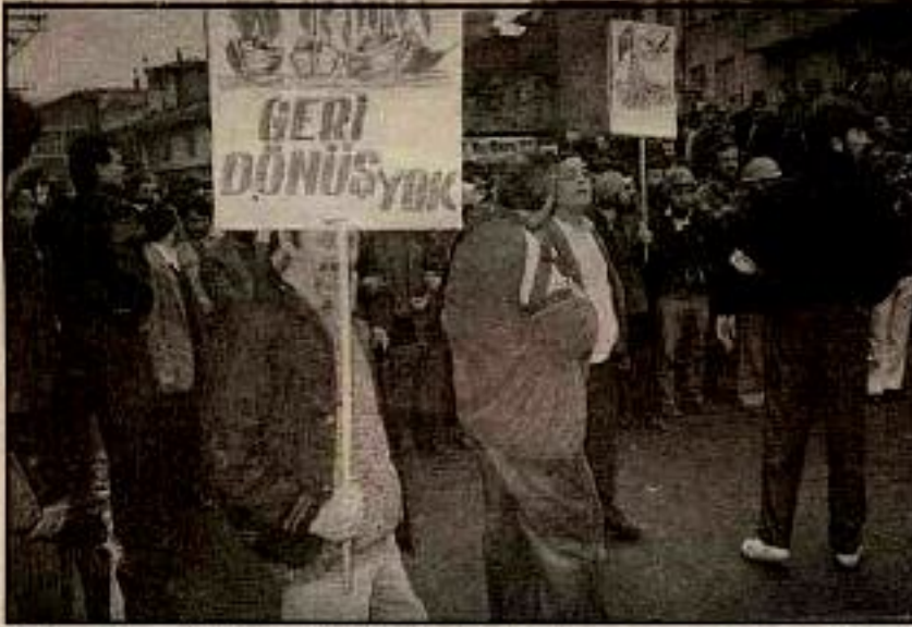
İşçi sınıfının iktidar yürüyüşünde bir öncü müfrezeydi Zonguldak. Ve bunu ilk farkedene de devrimciler değil burjuvazi oldu. Hemen Burjuva Sendikacılar tarafından satıldı.

uzanıyor. Faşist generallerini gasp ettiği hakları geri almak üzere Netaş işçilerinin grevi ile başlayan eylemlilik 1987'de öğrenci gençliğin kitlesel çıkışına denk geldi. İşçi sınıfı ve öğrenci gençlik, yitirilen hak ve mevzilerin tekrar kazanılıp ele geçirilmesi için daha o tarihlerde hareketlenmeye başlamıştı. Ancak, 1989 Bahar Eylemlerini işçi sınıfının hareketliliğinde bir dönüm noktası olarak ele almak daha doğru olacaktır. Çünkü, "89 Bahar Eylemleri" yüz binlerce işçinin katıldığı, kalmenin gerçek anlamında yığinsal eylemlerdi. Eylemler kendiliğinden bir özellik taşıyordu ve esas olarak ekonomik istemlerle sınırlıydı. Fakat bu, işçi sınıfının faaliyetlerinde büyük bir artış olduğu gerçeğini ortadan kaldırmıyordu. Yukarıda kendiliğinden eylemler arasındaki farklılığa işaret etmiş ve kendiliğinden eylem vardır, diyerek her kendiliğinden eylemin aynı kefeye konmayacağını vurgulamıştık. Üstelik kendiliğinden eylemlerde ilk bilinçlenmenin parıltılarını da görmek mümkün çünkü, işçiler "ba-