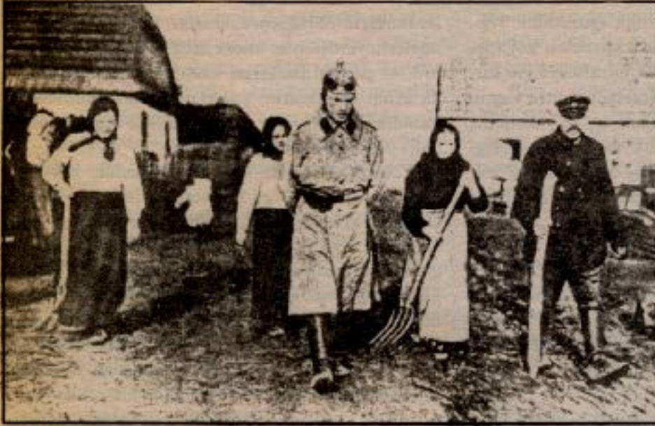
1914 Rusya'sında köylüler tarafından esir alınmış bir alman askeri

Kır emekçilerinin örgütlenme araçlarından biri Devrimci Köylü Komiteleridir. Komiteler, yoksul köylü komitelerinin yanında küçük köylüleri de kapsayacak karma komiteler biçiminde de oluşturulur. Devrimci Köylü komiteleri, köylülerin günlük sorunlarının çözümü için mücadele verirken, aynı zamanda devletin yıkılması içinde mücadele verirler. Bu amaçla mücadelenin ekonomik ve politik araçlarını bir araya getirirler. Yani bir taraftan tarım girdi fiyatlarını, genel fiyat artışlarını, vergileri vb. protesto eylemlerine başvururken; diğer taraftan büyük toprakları ve devlet ürün silolarını işgal etme eylemlerini geliştirirler, aynı zamanda devlet güçlerine karşı silahlı politik eylemlere yönelirler.