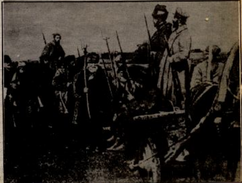
Bir bölük Devrimci Köylü Nisan 1917 Rusya.

Köylülüğün devrimci olanaklarının demokratik