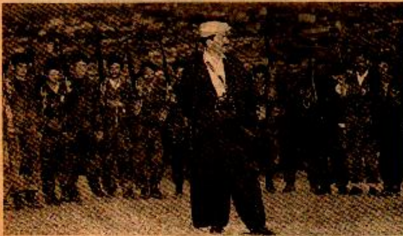
Korucular sermaye ve devlet için işledikleri cinayetlere karşılık her geçen gün biraz daha zenginleşiyorlar.

Burjuva savaş topluma daha fazla götürme getirdi. Yaşam koşulları emekçi kitleler için insanca değildir; insanlık dışı olsa yalnızca yaşam koşulları değildir; burjuvazi, emekçi kitleleri egemenlik altında tutmak için insanlık dışı olarak bilenen ve bilinmeyen ne kadar yöntem varsa hepsine başvuruyor. Türk tekelci sermayesinin karakteri ve amaçları iyi kavranmalı. Türk tekelci sermayesi, çıkarları için yapmayacağı kötülük, işlemediği cinayet, yapmayacağı işkence yoktur. Türk sermayesinin bu çapulu, gaspçı karakterini yansıtan faşist TC, kapitalist dü-