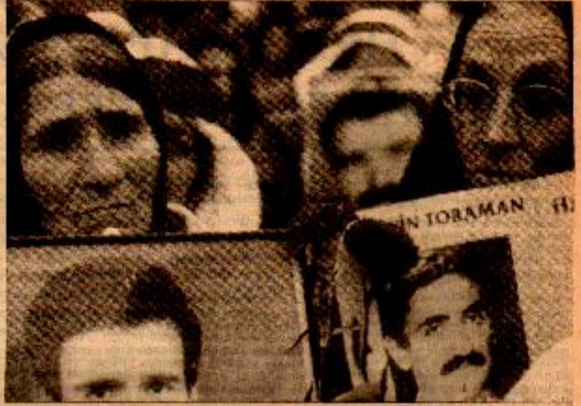
Kayıp Anneleri tüm ahlakaya rağmen her Cumartesi eylemlerini sürdürüyor.

Emperyalizmin ve işbirlikçi tekelci güçlerin o kadar tahdit, baskısı, gücü ve faşist devletin saldırıları, ne Kürdistan, özgürlük savaşından vazgeçirebilmiş, ne de Türkiye halkların devrim mücadelesinden vazgeçirebilmiştir. Şimdiye kadar uygulanan baskıların bütün metodları istenilen sonucu vermedi. Kitleler, yaşamlarında, bugüne kadar ki, en korkulu devrimi yaşıyorlar. Artık hiç bir baskı karşısında boyun eğmiyorlar. Her tarafta "yığınlar yok, direniş var" sesleri geliyor. 80'den sonra uygulamaya sokulan burjuva iç savaş, aradan geçen bunca zamana rağmen, sonuç getirmekten uzak görünüyor. Burjuva iç savaşın yanında, proletar iç savaş (devrimci iç savaş) da görülmeye başladı. Bu durum, egemenler ve zillerler arasında bir ölüm-kalım savaşına kapılmaya başladığını gösteriyor. Ne tekelci güçler ve emperyalizm çıkarlarından ve iktidarlarından vazgeçmeye niyetliler, ne de, emekçi kitleler, bugünkü durumdan dönmeye niyetli. Şimdi Kürdistan ve Türkiye'de tarih iç savaş ve bü-