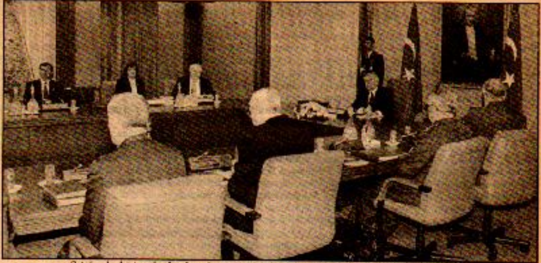
Çetele devlet tarafından kurumsallaştırılan ve Milli Güvenlik Kurulu'ndan bağımsızlaştırılmıştır.

geniştirme ve illegal devrimci örgütlere karşı mücadele için de- ğil, topluma cinayet ve in- kâzlarla terörizm işlemek, yılmamak ve böylece dev- rimci örgütlere desteğini kesmek için de gereklidi. Bunun için gerekli olan altyapıyı "Özel Harp Dairesi", "Terörle muca- dele timleri", "Özel hare- kat timleri" gibi birimler sağlıyordu. Geriye, buradan seçilecek elemanların sivil-faşistler ve mafya ile takviye edilmesiyle yeni bir organizasyona gir- mek kalıyordu. Cumhurbaşkanı başkanı'dan Genelkur- mayına kadar tüm Milli birimlerin bilgisi dahilinde