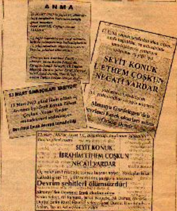
13 Mart ile ilgili Avrupa'daki günlük gazetelerde yayınlanan ilanlar.