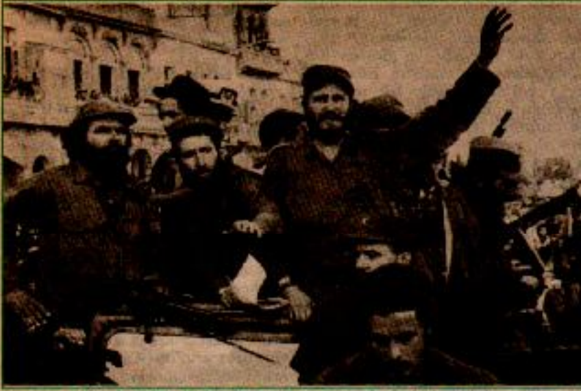
2 Ocak 1959 Fidel Castro Santiago de Cuba'ya giriyor.

Latin Amerika halklarına ayağa kaldırdığı için, devrim mücadelesinde onlara destek verdiği için, sosyalist varlığıyla büyük bir moral kaynağı olduğu için ABD emperyalizmi, Sosyalist Küba'ya karşı devamlı saldırı içinde oldu. Ama Küba önce saldırı, kuşatma, baskılara rağmen devrimci bir mevzi ve sosyalizmin sağlam kalesi olarak görevini tam 38 yıldır sürdürüyor.