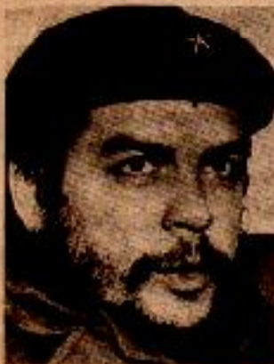
Küba Devriminin unutulmaz liderlerinden Che Guevara