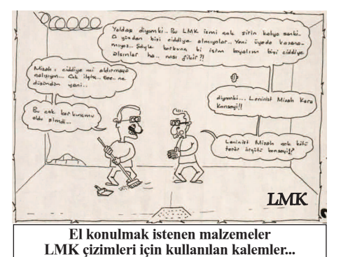
El konulmak istenen malzemeler LMK çizimleri için kullanılan kalemler...

lara yapılan işkencenin boyutunu ortaya koyuyor. Bugün bir başka müvekkilimin davasına girdiğim sırada bu bilgiye ulaşmış olmam, cezaevlerindeki durumun ciddiyetini ortaya koyuyor. Ve biz tutsakların hayatlarından endişeliyiz. Kamuoyunun bu konuya daha duyarlı olmasını bekliyoruz" dedi.