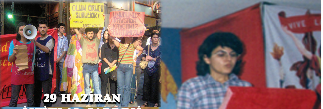
29 HAZİRAN İSTİKLAL CADDESİ