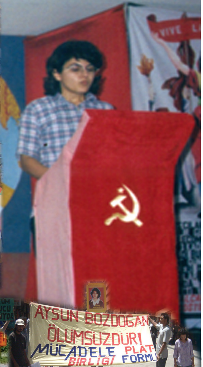
27 HAZİRAN 2005 İZMİR