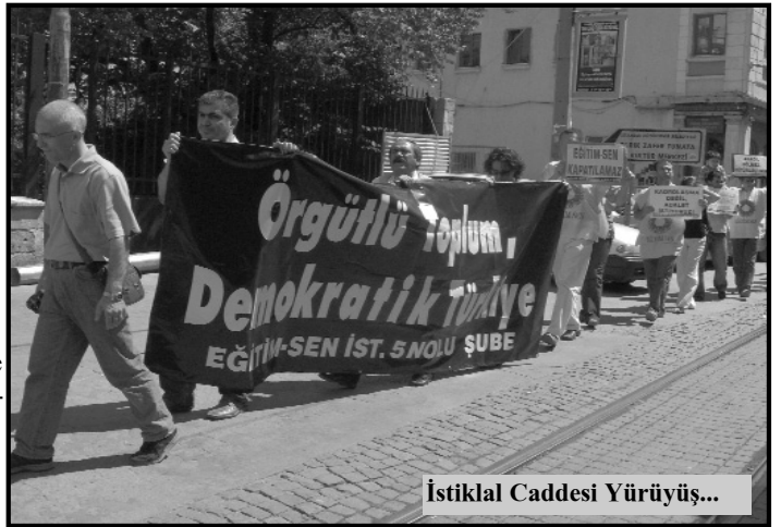
İstiklal Caddesi Yürüyüş...

24 Haziran günü bir araya gelen eğitim emekçileri ve onları destekleyenler, zincir oluşturarak Basmane Meydanı’ndan Konak Sümerbank önüne kadar sloganlarla yürüdüler.