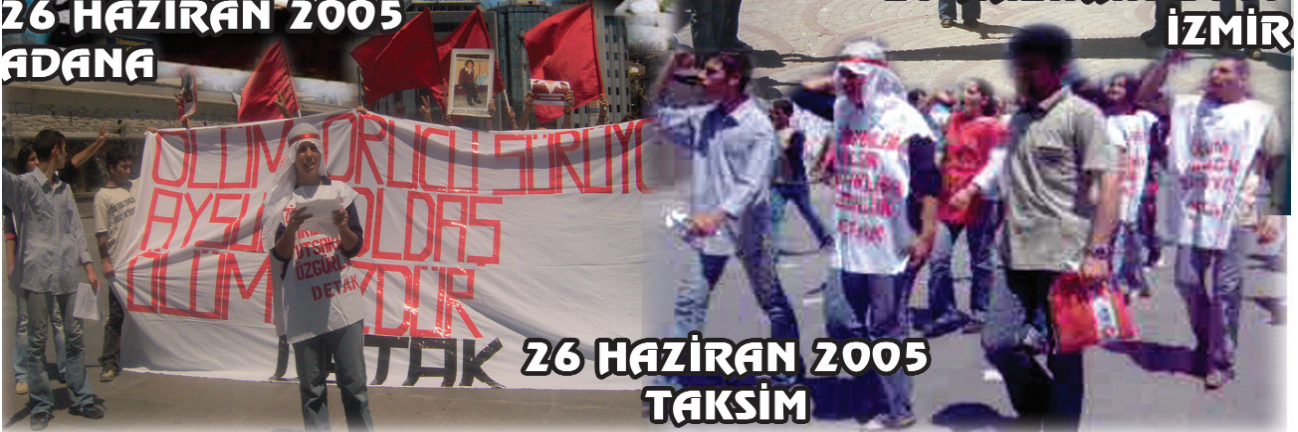
26 HAZİRAN 2005 TAKSİM