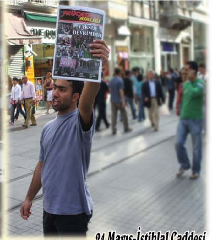
24 Mayıs-İstiklal Caddesi