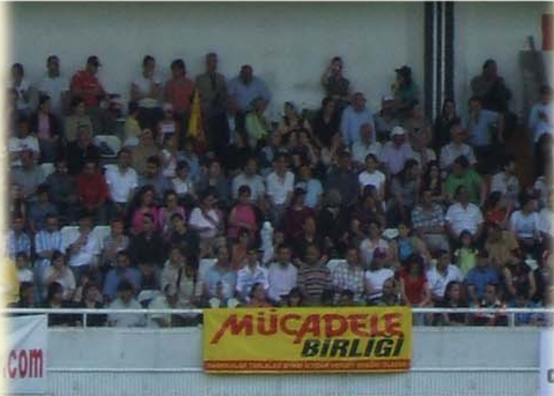
27 Mayıs-İnönü Stadi