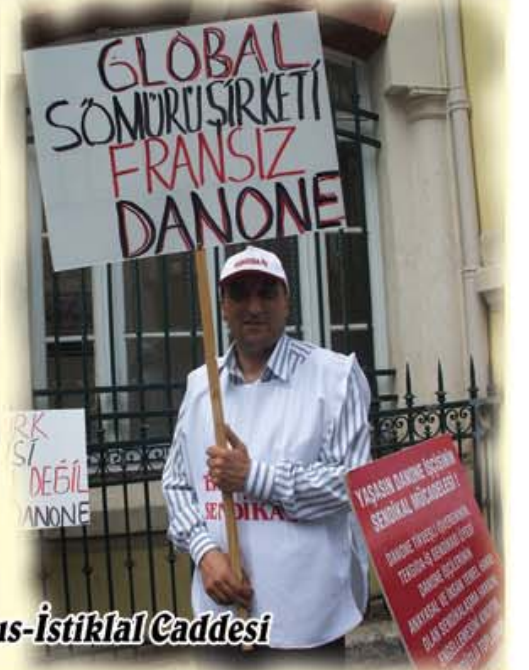
21 Mayıs-İstiklal Caddesi