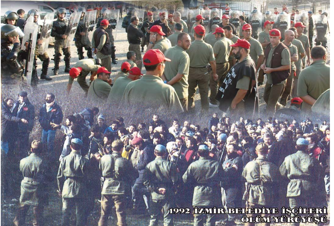
1992 İZMİR BELEDİYE İŞÇİLERİ ÖLÜM YÜRÜYÜŞÜ