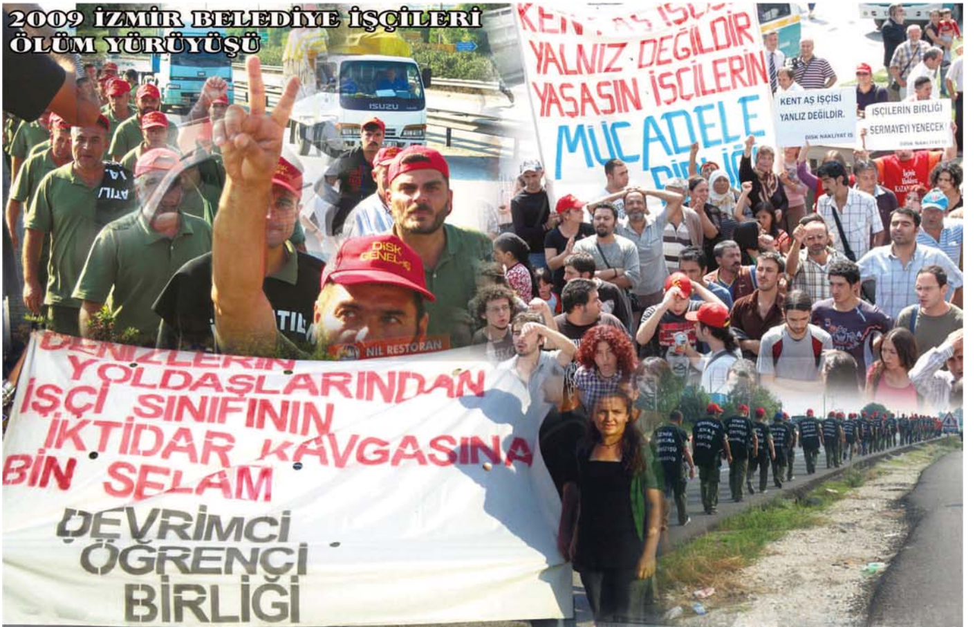
2009 İZMİR BELEDİYE İŞÇİLERİ ÖLÜM YÜRÜYÜŞÜ