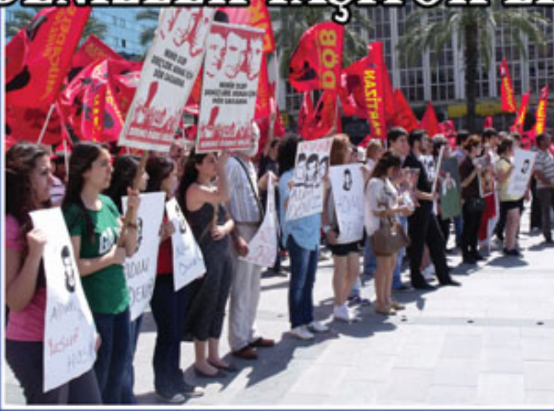
6 Mayıs 2012 İzmir