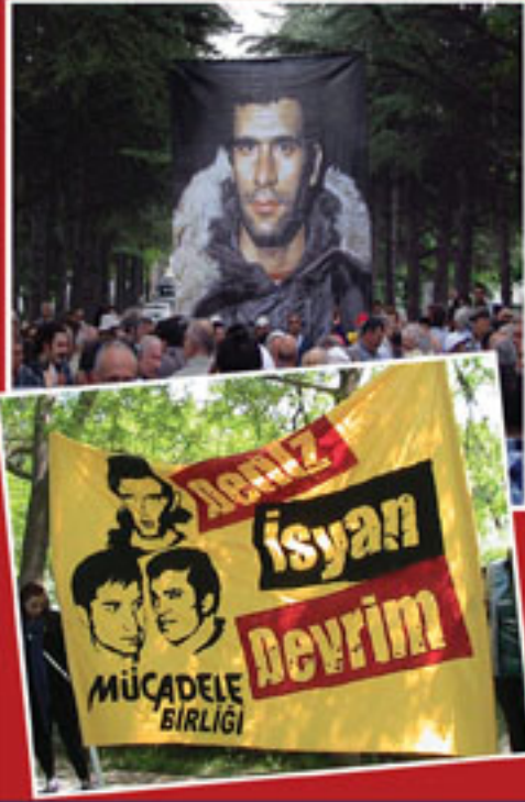
6 Mayıs 2012 Ankara