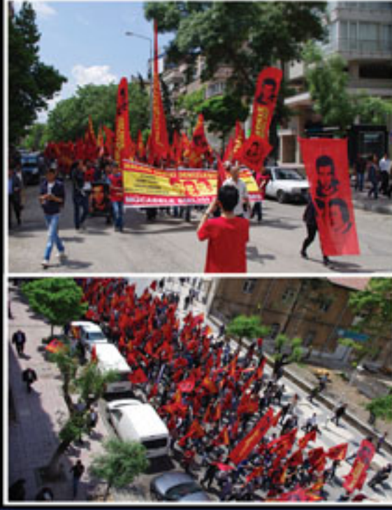
6 Mayıs 2012 Antep