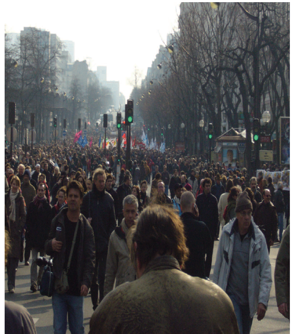
2006'da Paris'te CPE Karşı Yapılan Bir Eylem